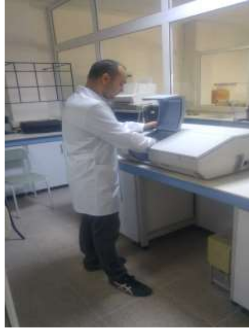
FTIR (Perkin Elmer Spectrum BX) (Fourier Transform Infrared Spectrometer)