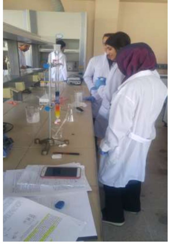
A358-A359 Öğrenci Laboratuvarları