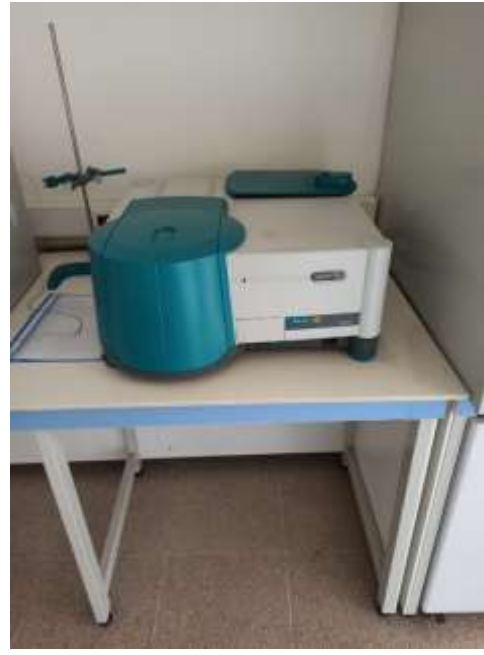
Florimetri (Varian Cary Eclipse)