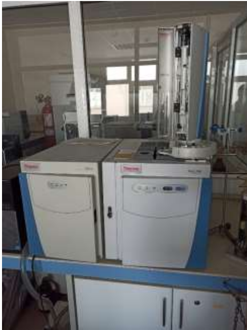
TG-DTA (Perkin-Elmer TG-DTA Diamond)