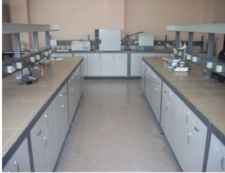
A 359 Öğrenci Laboratuvarı

Laboratuvarlarımız ve Laboratuvarlarımızda bulunan cihazlarımız iç paydaşların etkin kullanımına açıktır