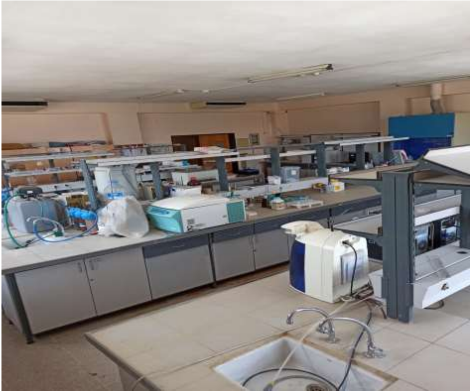
A 354 Biyokimya Araştırma Laboratuvarı