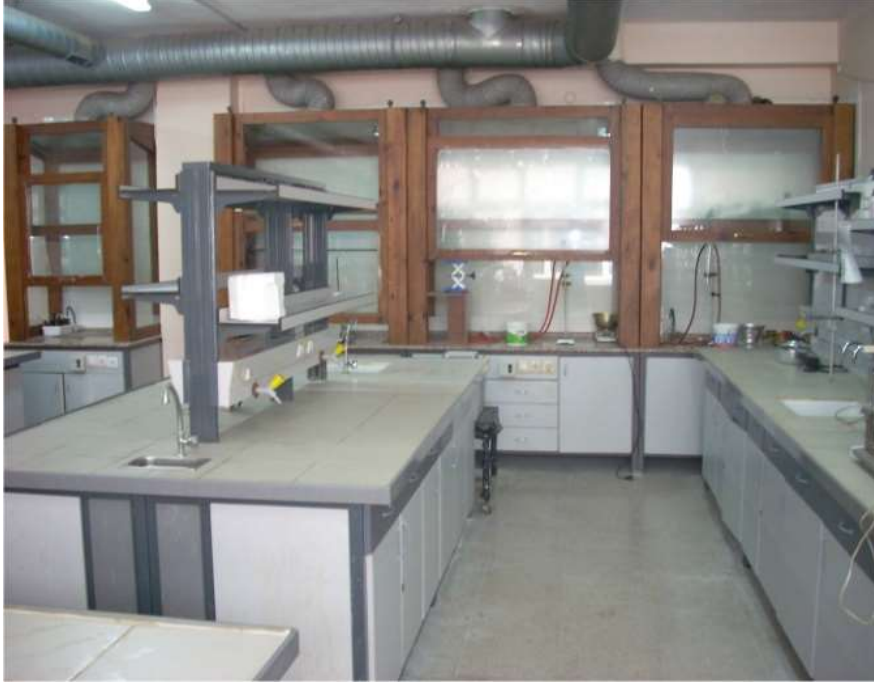
A 356 Organik Kimya Araştırma Laboratuvarı