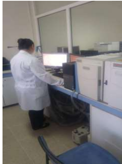
GC-MS (Gas Chromatography System) (Thermo Scientific Trace 1300)