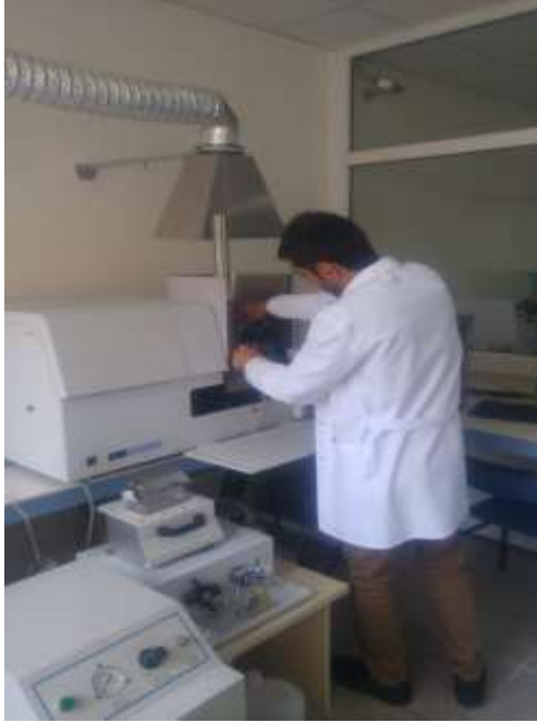
AAS (Atomic absorption spectrometer) (Perkin Elmer Analyst 700)