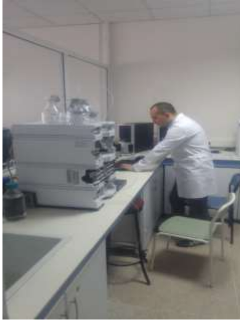
HPLC (Agilent 1260) (High pressure liquid chromatography system)