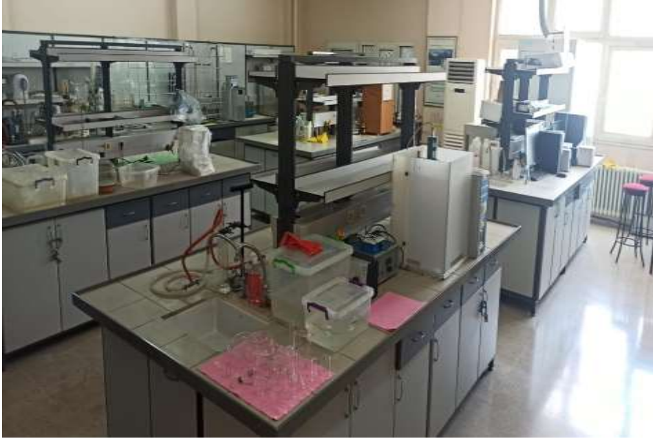
A 353 Anorganik Kimya Araştırma Laboratuvarı