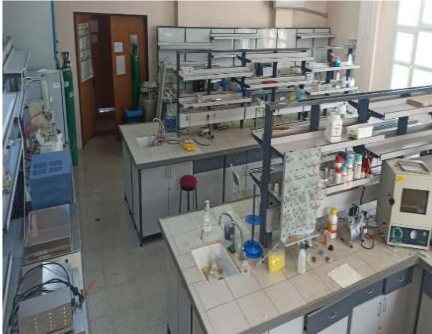
A 355 Analitik Kimya-Fizikokimya Araştırma Laboratuvarı