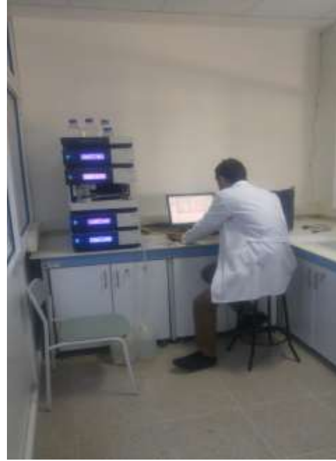
HPLC (Thermo Scientific Dionex Ultimate 3000) (High pressure liquid chromatography system)