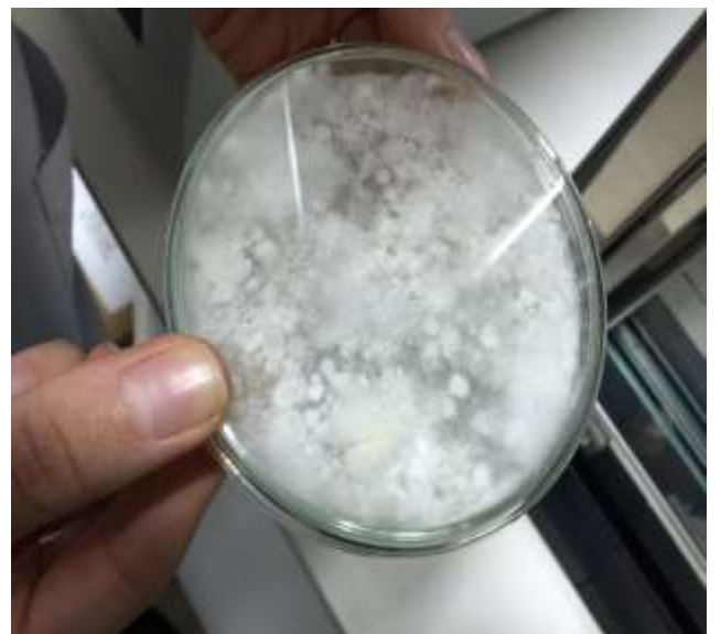
A 458-A 459 Biyokimya Araştırma Laboratuvarları