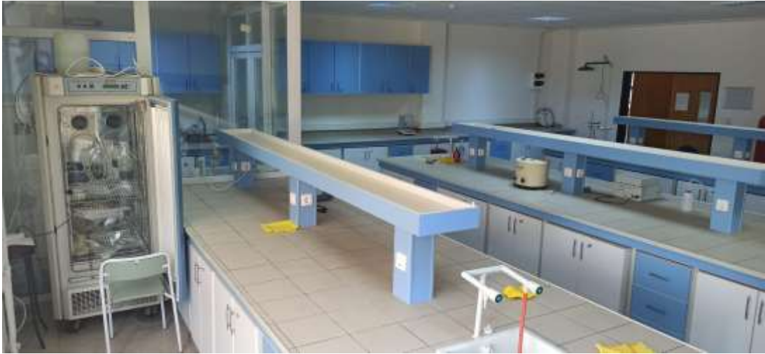
A 360 Öğrenci Laboratuvarı