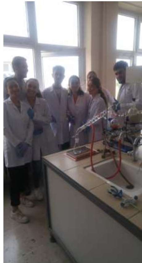
A 358 Öğrenci Laboratuvarı