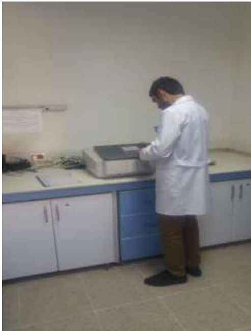
UV-Visible spectrophotometer (Thermo Scientific Evolution 220) (Shimadzu UV 1800)